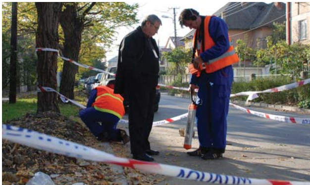
Imagini din timpul probelor de concurs, 2 noiembrie