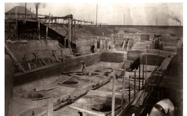
Fotografie din timpul lucrărilor de construcții de la stația de epurare, 1911

În luna iulie, Vidrighin atrage atenția constructorului că întârzierea punerii în funcțiune a stației la data stabilită prin contract atrage după sine penalități, ușor cuantificabile,